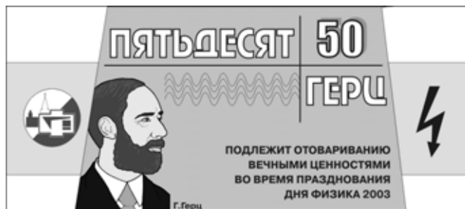
Валюта Дня Физика образца 2003 года

Была такая история. Хотели очень поехать на ДФ в Одессу. Но денег не было. Пошли в профком. Там вдруг говорят, что, мол, скоро "Студенческая весна" и если мы представим полнометражный спектакль, то нам оплатят билеты в Одессу. Нормально. Зотин идет в библиотеку, берет Гельмана, автора таких пьес, как "Цемент", "Парторг" и др. Почитав пять минут, понимает, что таких пьес можно написать сколько хочешь. А между прочим остается 2 дня. А полнометражный